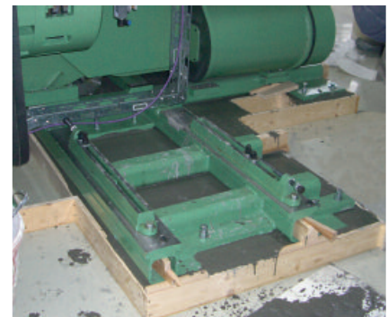
Mit PCI Repaflow werden Last abtragende Verbindungen geschaffen.