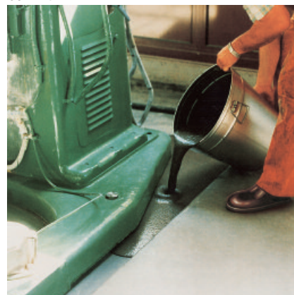
PCI Repaflow ist fließfähig und füllt horizontale Hohlräume selbstverlaufend.