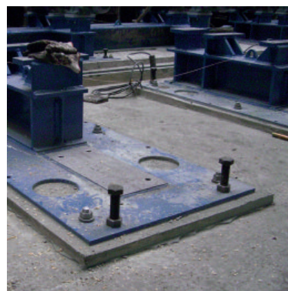
PCI Repaflow schafft eine nahtlose, risse- und hohlraumfreie Verbindung, die einen ruhigen Maschinenverlauf und dadurch präziseres Arbeiten und geringeren Maschinenverschleiß bewirkt.

Frei liegende Mörtelflächen mit feuchten Tüchern oder Polyethylenfolie vor Austrocknung schützen. Die Schaltung kann nach ca. 12 Stunden entfernt werden.